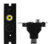
Option för video anslutningar S-video, Komposite / BNC in och ut